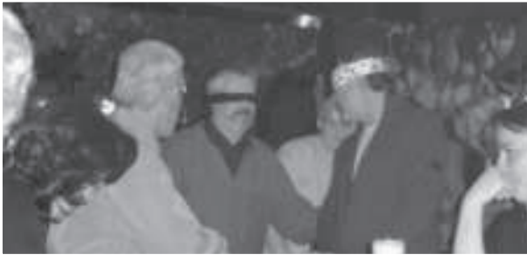
Vor der Ehrung

Gez. Horst Sichelschmidt, 1. Schriftführer der Ges. „Reserve“