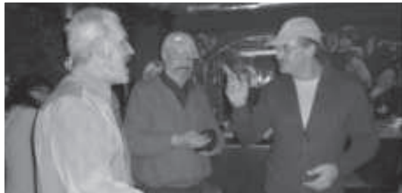
Nach der Ehrung